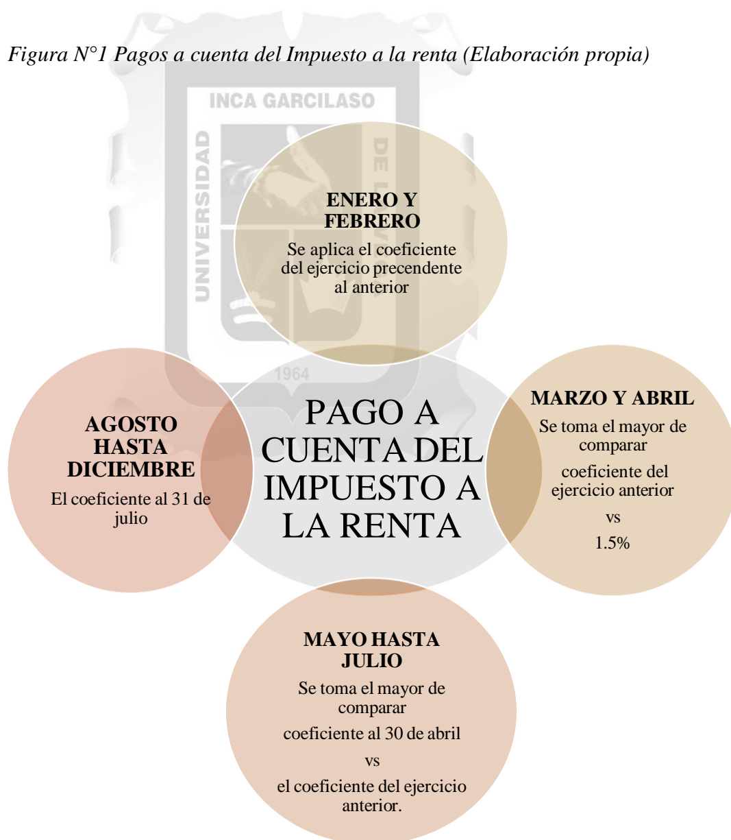
Figura N°1 Pagos a cuenta del Impuesto a la renta (Elaboración propia)

Además, que el contribuyente no cuenta con una guía que sirva como soporte para la presentación de estos requisitos y muy pocas probabilidades a favor de lo solicitado.