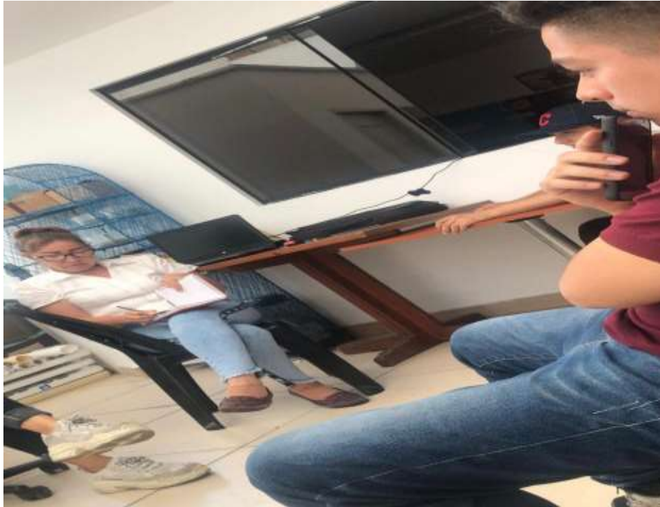
Anexo 2. Una foto con mi equipo de trabajo.