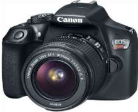
Figura 16. Cámara canon EOS REBEL T6.

A continuación la cámara con la que trabajabamos: