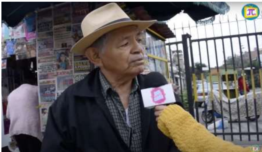
Figura 13. Entrevista acerca del “Día Mundial Sin Tabaco”.

Por otro lado, esos fueron los reportajes y entrevistas que fueron realizados a lo largo de mi trayectoria como reportera en mis prácticas profesionales en la productora. Con mi equipo de trabajo día a día nos esforzábamos para elegir la mejor definición e investigación profunda para proceder con la elaboración de las preguntas.