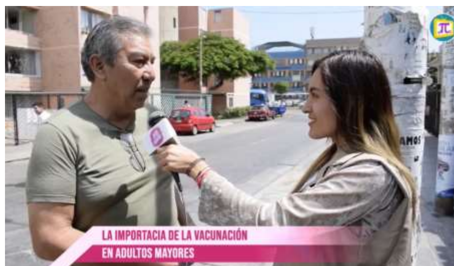
Figura 6. Entrevista acerca de la “Importancia de la vacunación”.

Luego, para el día 24 de abril tuvimos muchos percances nos toco realizar el tema de “El Prolapso”, siempre nuestra principal función era de buscar información. Al comienzo cuando salía a las calles, si me daba un poco de vergüenza porque no es nada fácil encontrar a personas que nos puedan colaborar con la entrevista. Las principales preguntas fueron: