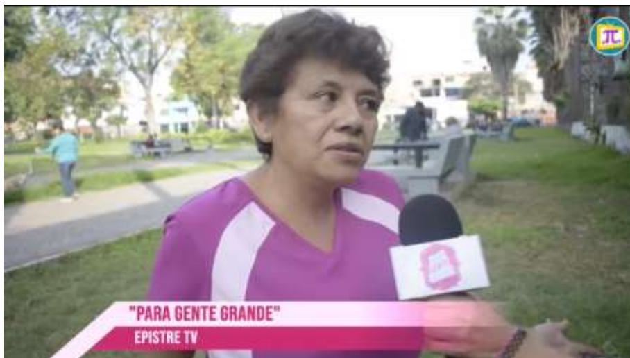
Figura 11. Entrevista acerca del “Día Internacional de la donación de órganos y tejidos”.

Finalmente, cumpliendo todo los requisitos para llevar a cabo esta gran labor. Se dio el último reportaje, elaborado el 29 de mayo de 2019. Elaborandose el tema del “Día Mundial Sin Tabaco”. Se procedió a realizar una profunda investigación y elaborar las preguntas que a continuación se muestran: