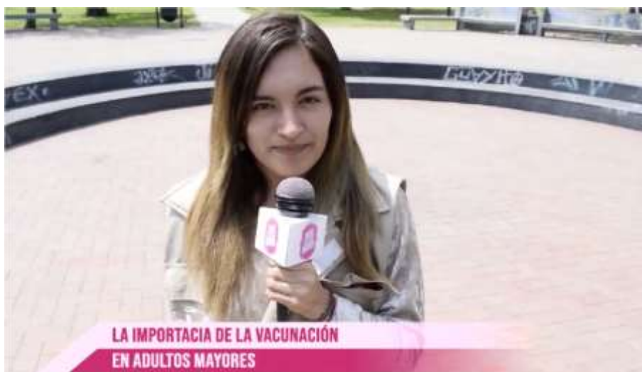
Figura 5. Reportaje acerca de la “Importancia de la vacunación”.