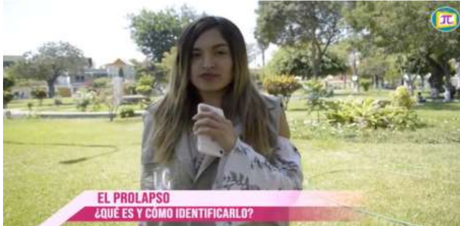
Figura 7. Reportaje acerca de “El Prolapso”.

Esa y muchas preguntas más fueron tocadas ese día para nuestro reportaje y entrevista.