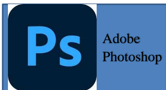
Figura 18. Logo del programa de edición “Adobe Photoshop”.