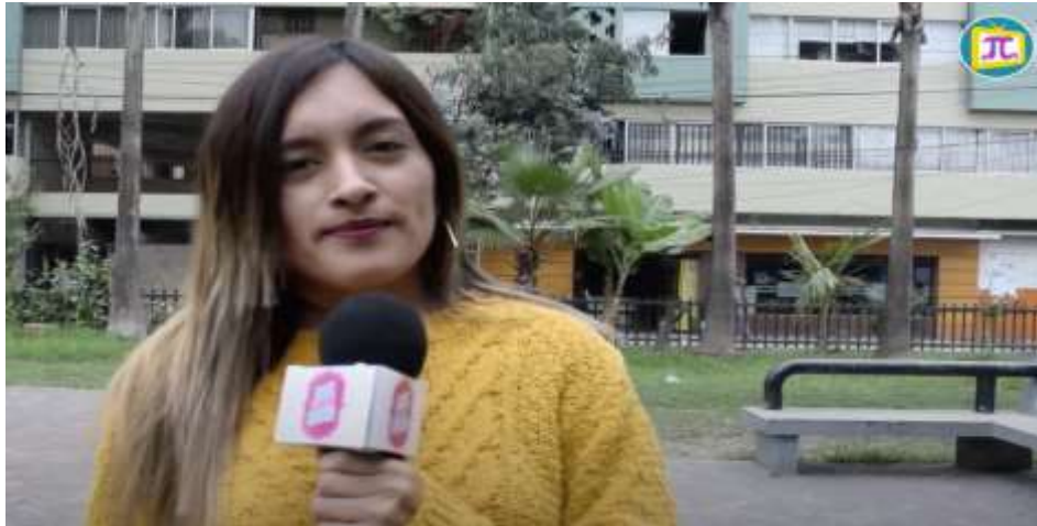
Figura 12. Reportaje acerca del “Día Mundial Sin Tabaco”.