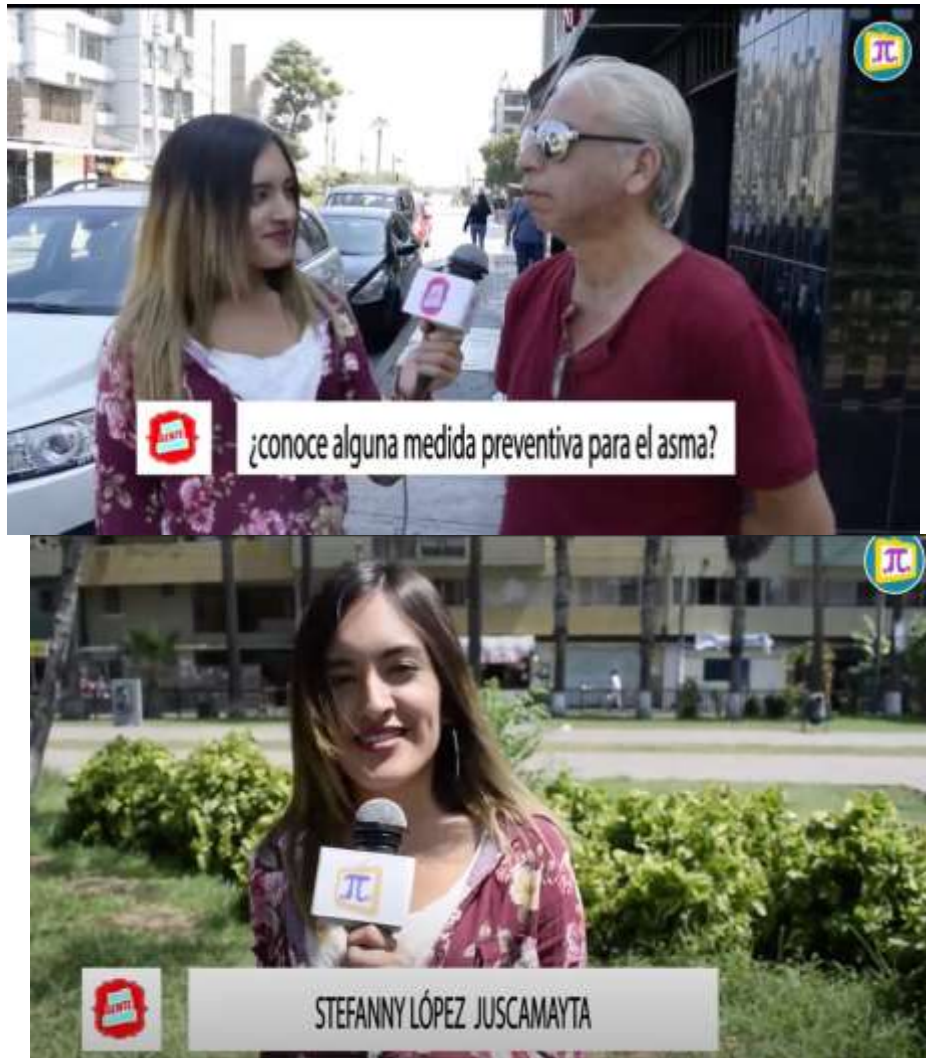
Figura 8. Reportaje acerca del “Día Mundial del Asma”.