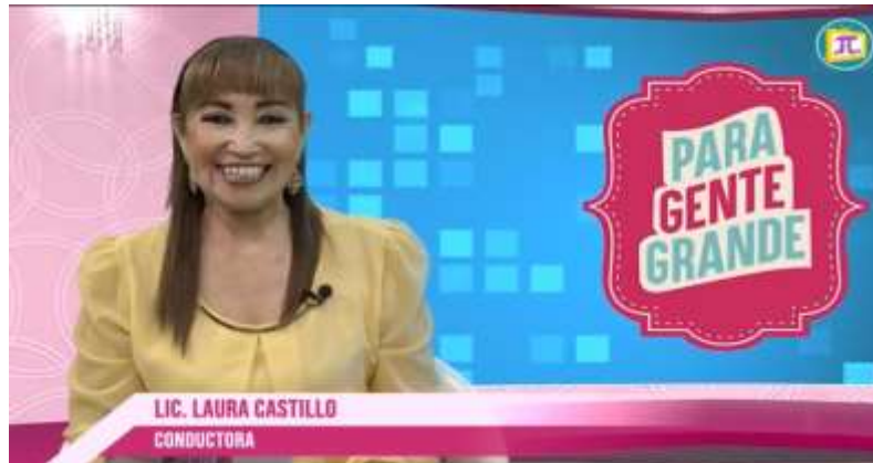
Figura 4. Conductora del programa Para Gente Grande.

Mi primer reportaje como entrevistadora fue el 17 de abril, ni bien ingresé comenzamos con el equipo a tener una alta responsabilidad porque teníamos solo 2 días para tener la secuencia lista.