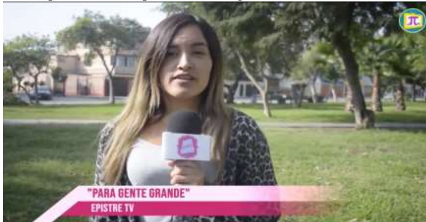
Figura 10. Reportaje acerca del “Día Internacional de la donación de órganos y tejidos”.