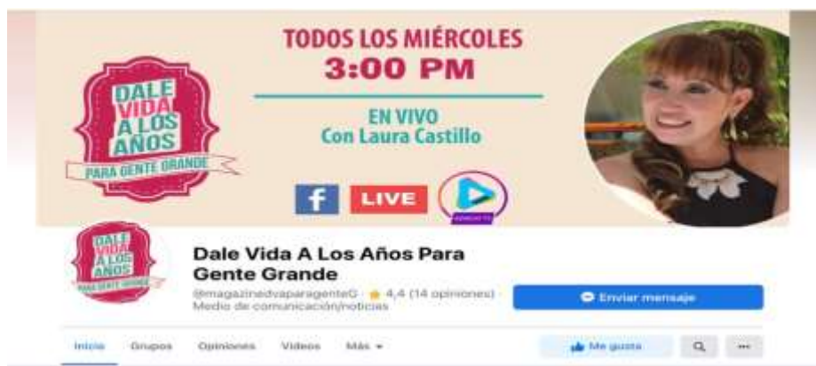
Figura 3. Página principal del programa Para Gente Grande.