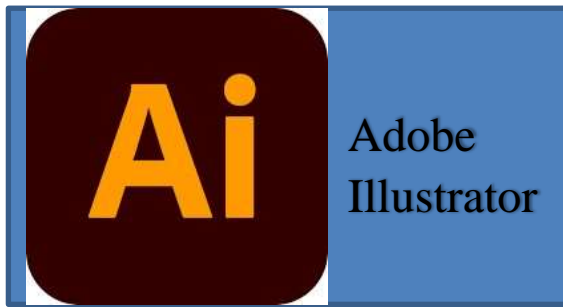
Figura 19. Logo del programa de edición “Adobe Illustrator”.