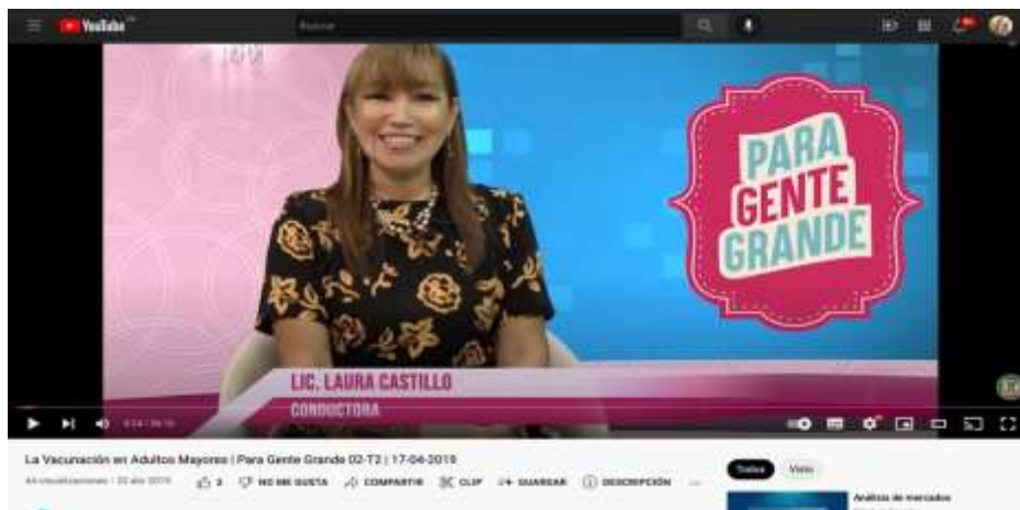
Figura 15. Transmisión en vivo por la plataforma de Youtube.