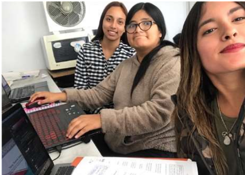
Anexo 3. La oficina del área de Post producción.