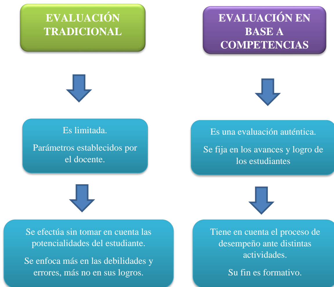
Figura 1. Diferencias entre la evaluación tradicional y competencial (elaboración propia)