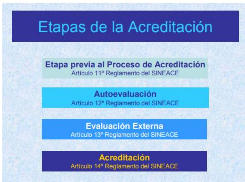
Figura 4. Etapas de la acreditación