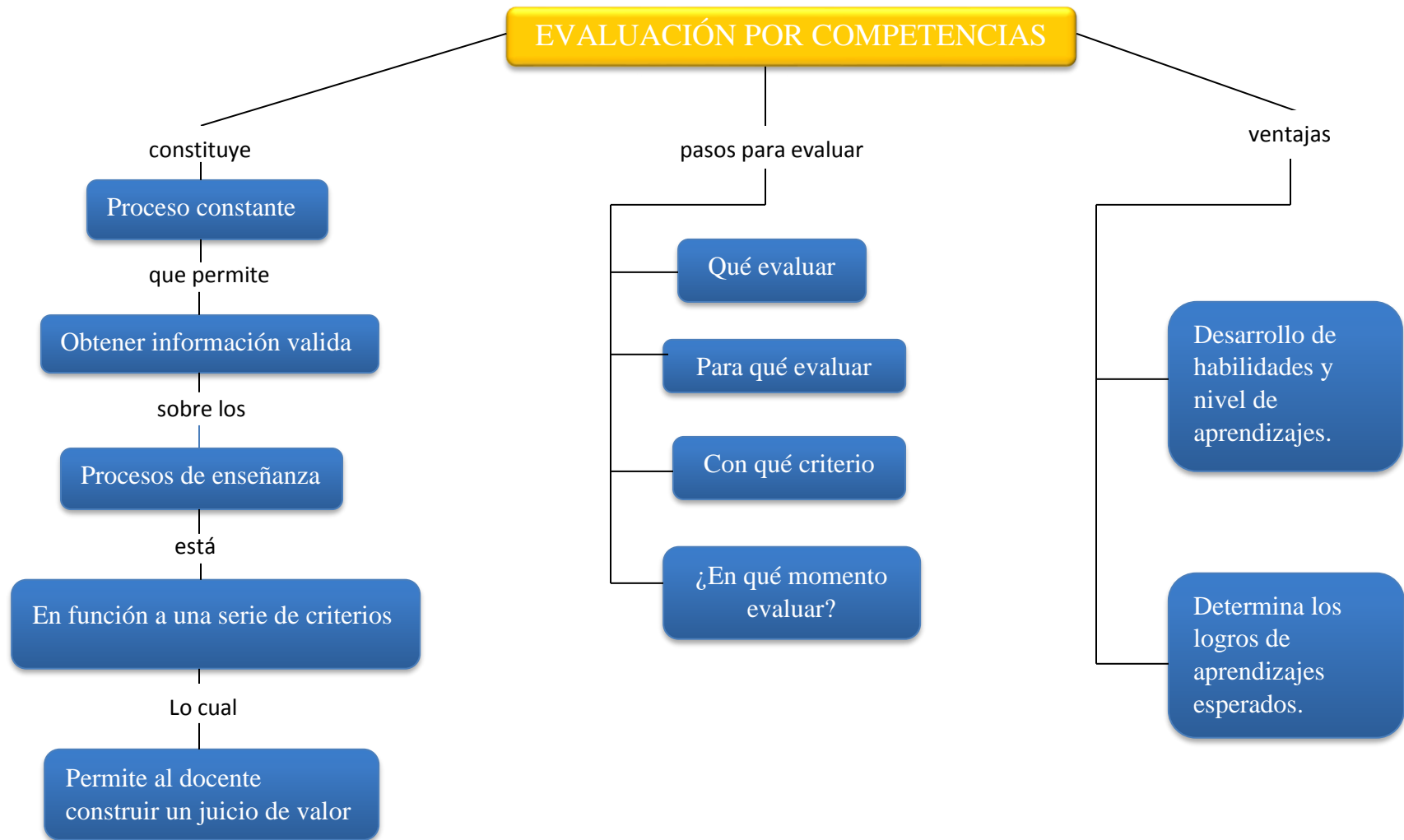
Figura 2. Mapa conceptual de definición de la evaluación competencial (elaboración propia)