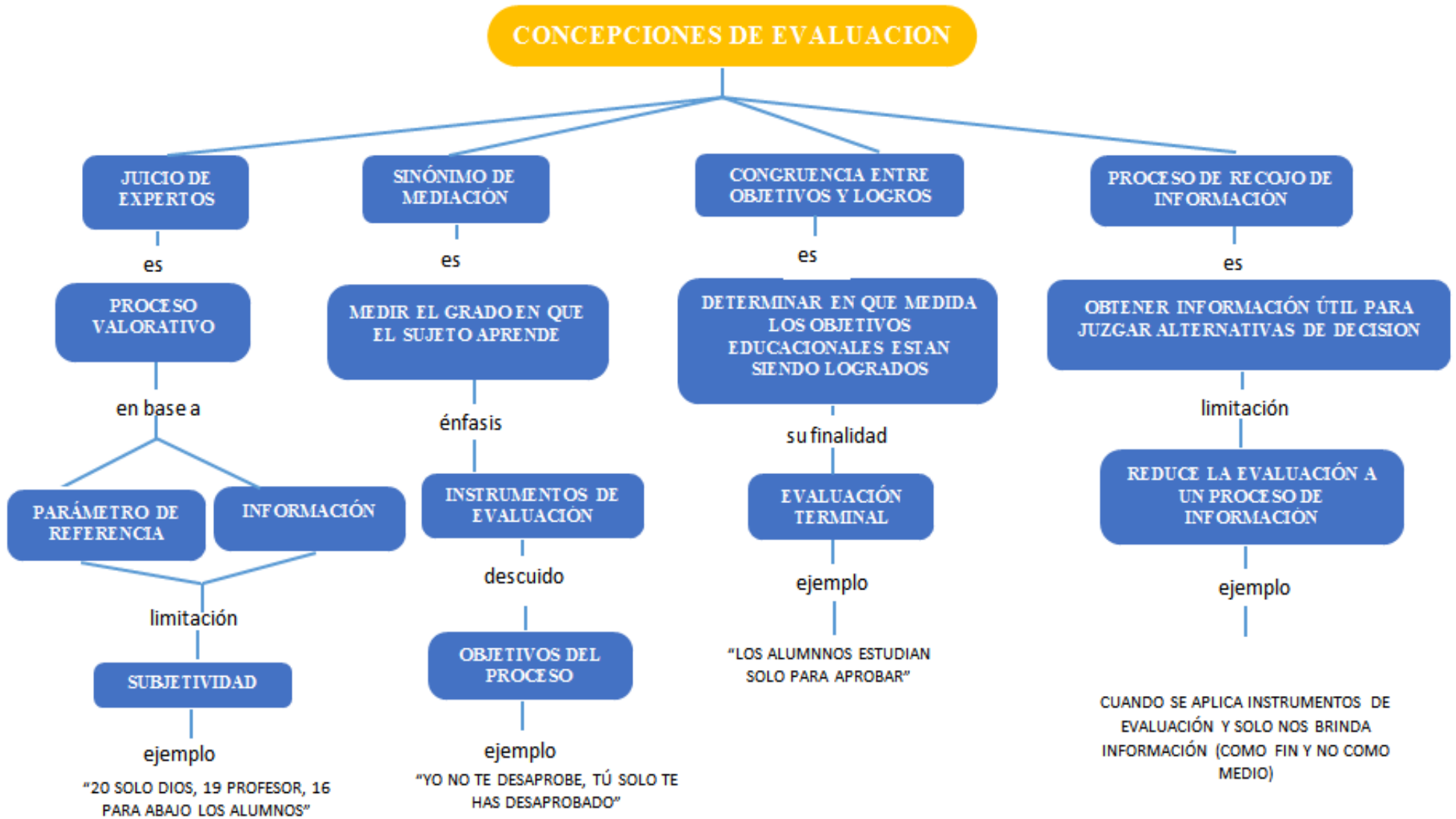
Figura 3. Mapa conceptual de definición de la evaluación tradicional (elaboración propia)