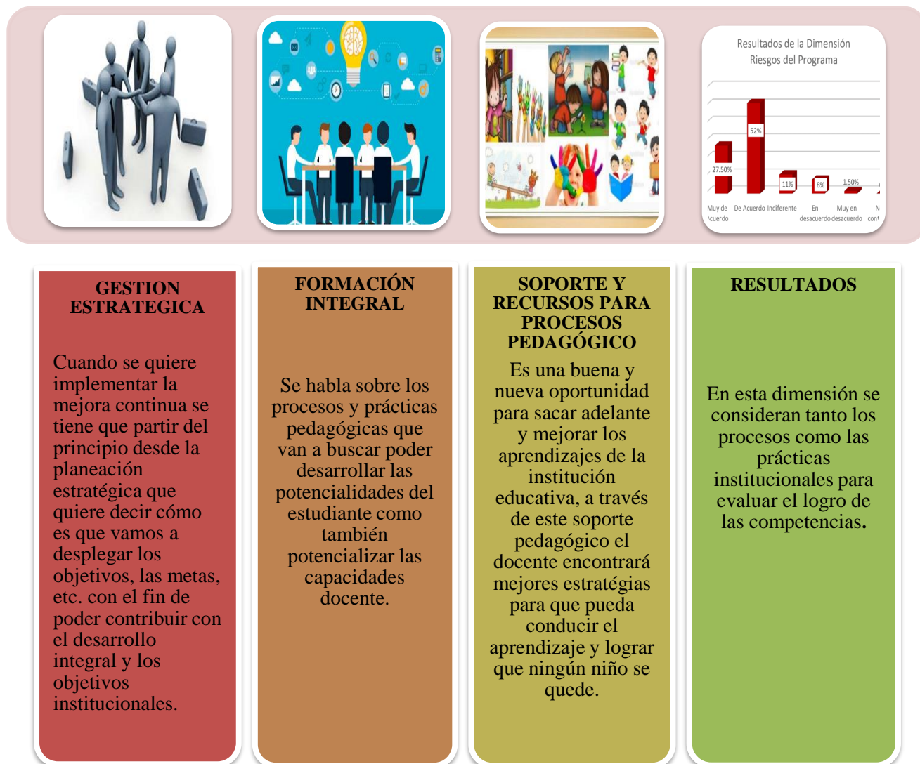
Figura 6. Las 4 dimensiones del modelo de acreditación (elaboración)

Como institución educativa se quiere lo mejor para los estudiantes porque ellos son el centro de nuestros quehaceres institucionales, es por ello que todas las acciones tomadas están encaminadas al logro de sus competencias, pero sobre todo a la formación integral del estudiante.