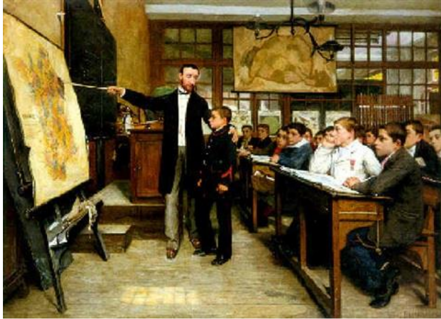
(Inicios de la educación Moderna)