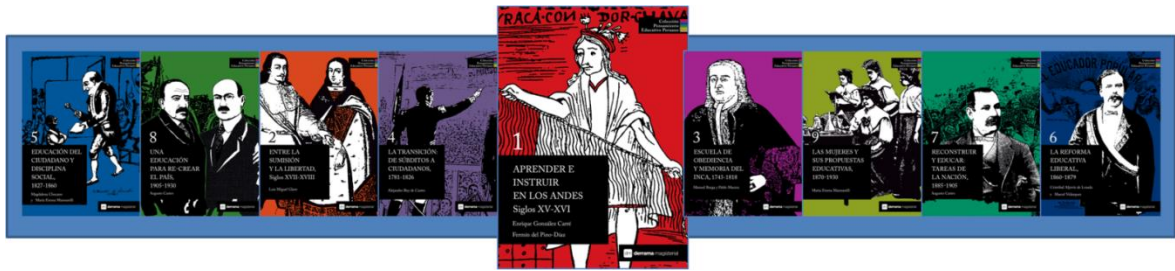
(Compendio de libros de información actual)