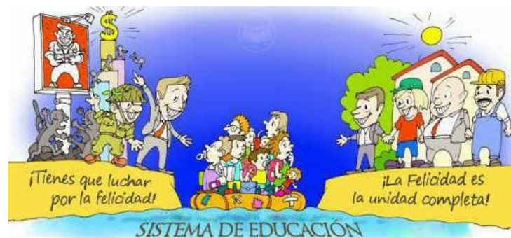
(Reflejo de una Sociedad o Cambio de Respetiva)