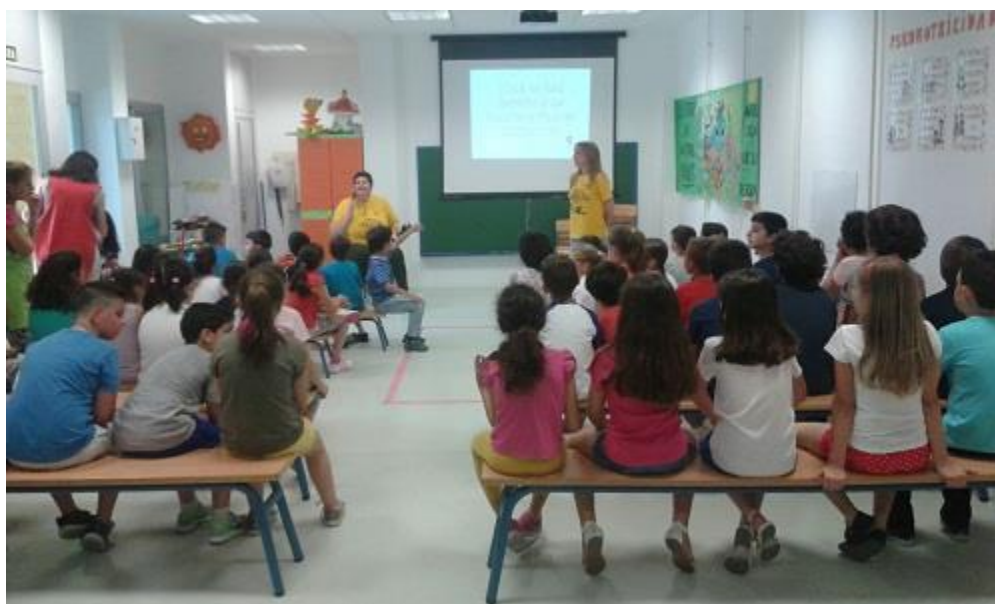
(Respeto dado y aprovechado)