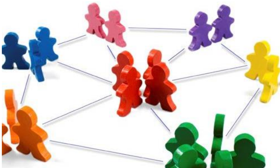
(Grupos de formación personal)