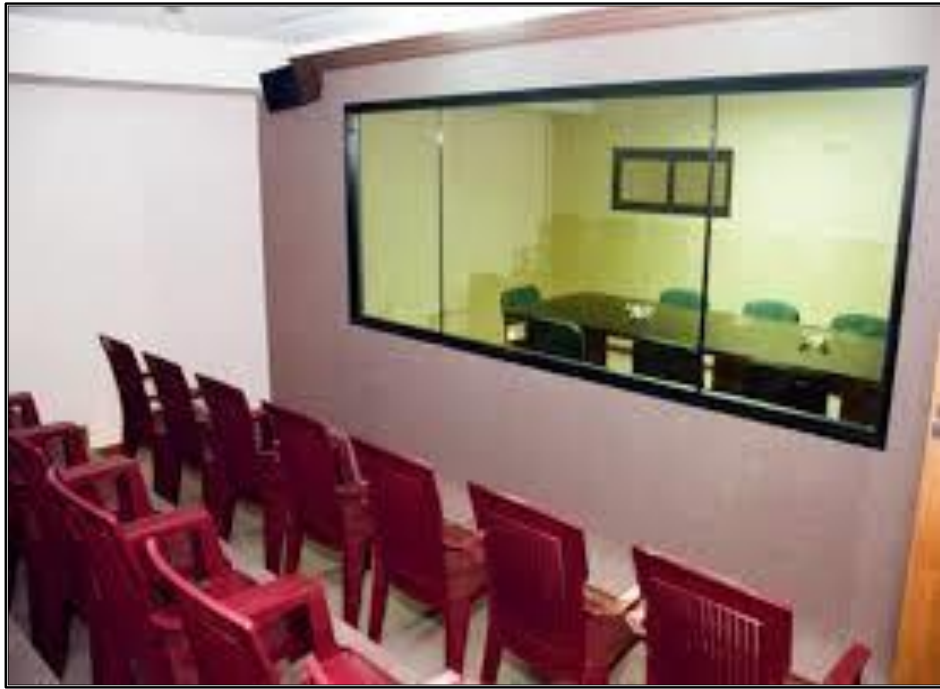
AMBIENTE DE OBSERVACION EN CAMARA GESELL, EN LA SALA DE ENTREVISTA NO EXISTE LA DIVISION DEL ESPEJO

Cuando ingresa una denuncia en el Distrito Fiscal de Lima Este por los delitos de Violación Sexual de menor de edad o por el delito de Actos Contra El Pudor en menores de 14 años, se solicita como primera medida a la Unidad de Medicina Legal de Santa Anita se otorgue fecha para la utilización de Cámara Gesell, cuando esta fecha se otorga nos damos con la sorpresa de que, desde la fecha del ingreso de la denuncia hasta la fecha en que la menor pueda utilizar dicha cámara, transcurren entre dos y cuatro meses, siendo un problema esto, por lo que es de vital importancia que se aperturen más Cámaras Gesell a nivel nacional o en su defecto Salas de Entrevista Única para evitar la revictimización de las víctimas; por ejemplo tenemos los casos de: