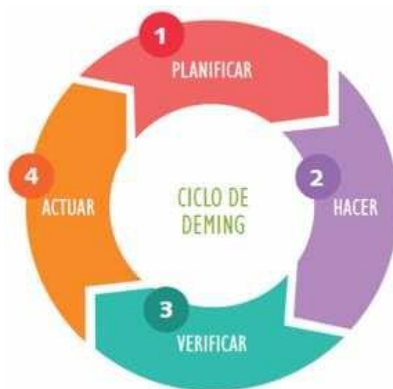
Gráfico N° 2: Principales instrumentos de la Gestión Educativa.