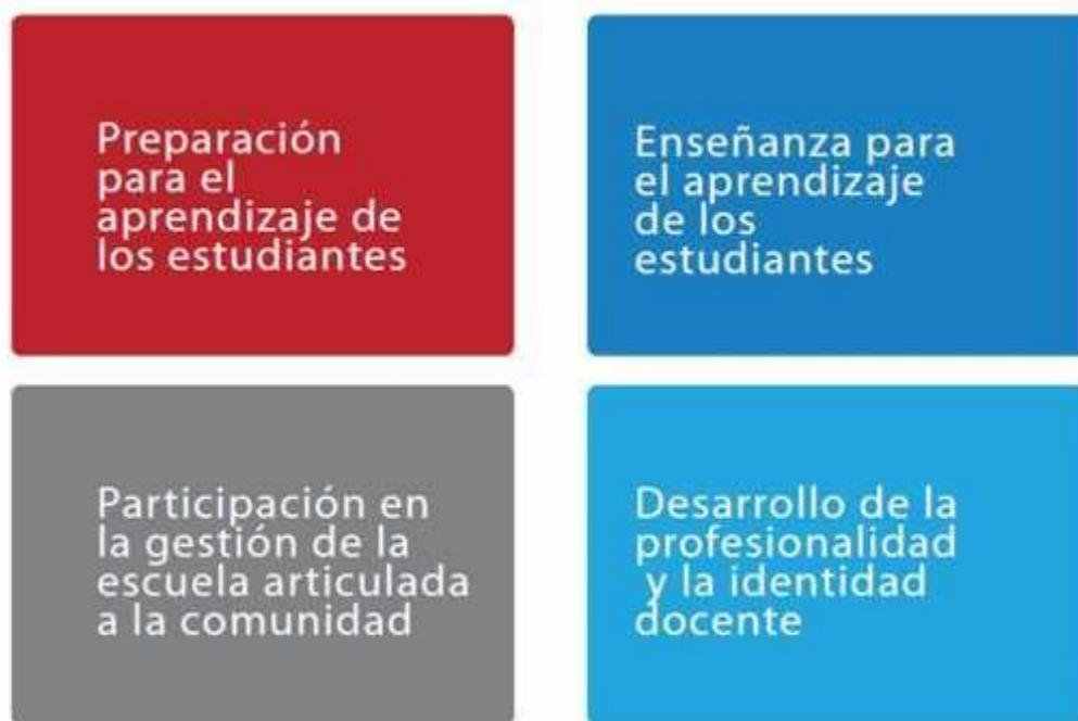
Gráfico N° 4: Los cuatro dominios del Marco del Buen Desempeño Docente