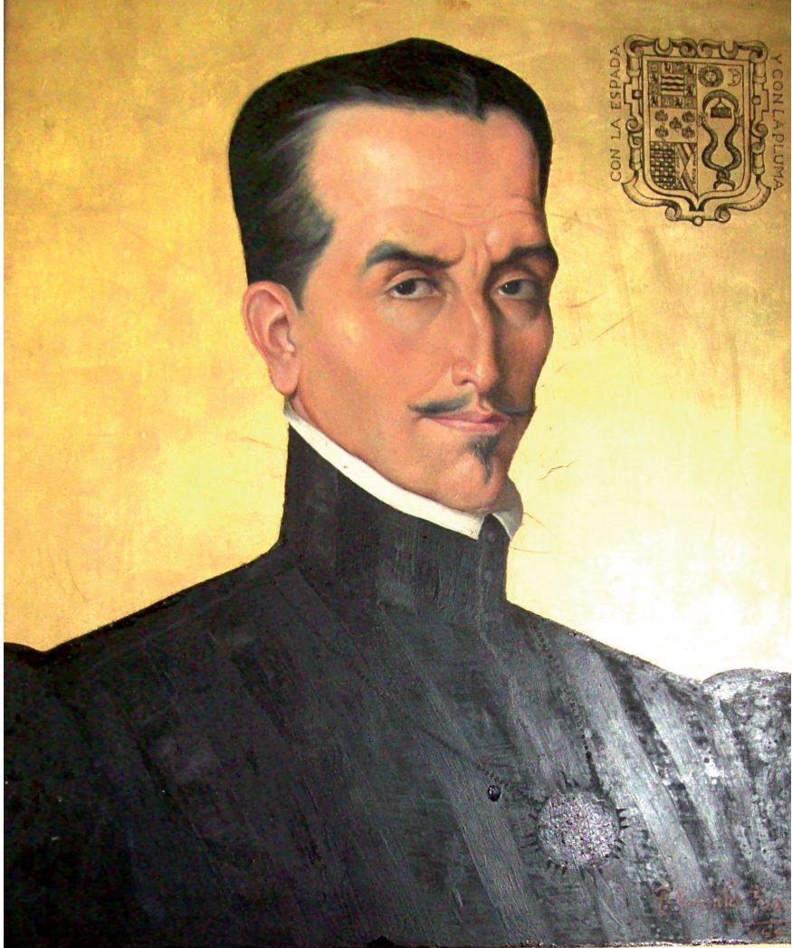
INCA GARCILASO DE LA VEGA 1539-1616