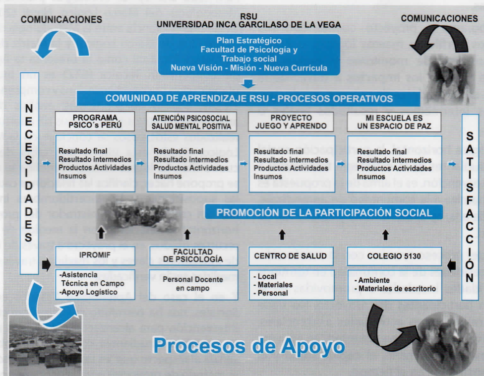
Figura 2.- Cuadro comparativo propuesta curricular para Trabajo Social.

Se identifica la zona que corresponde al ámbito de intervención, denominado Proyecto Piloto Nuevo Pachacútec, arenal considerado como zona urbano marginal en situación de extrema pobreza.